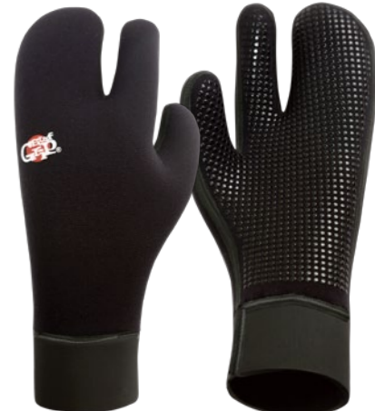
"Q.W.R." LOBSTER GLOVE

[GLOVE SIZEの見方] XXS: 7.0cm / 18cm XS: 7.5cm / 19cm S: 7.9cm / 20cm M: 8.2cm / 21cm L: 8.5cm / 22cm XL: 9.0cm / 23cm ※中指長(中指の長さ) / 外周(人差し指付け根と小指付け根を通った手の平の外周) ※サイズはおおよその目安になります。厚みや素材により同サイズでもフィット感が若干変わる場合がございます。予めご了承ください