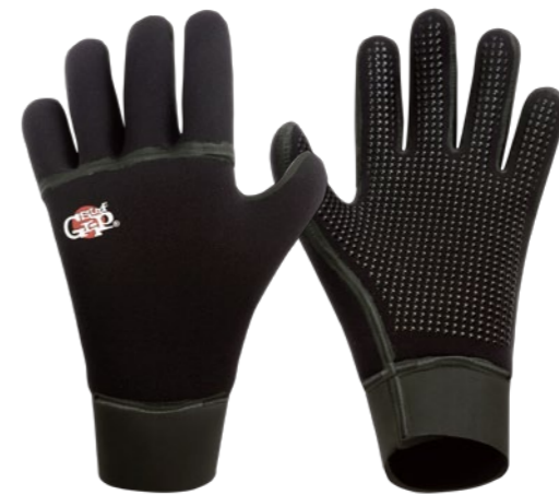
"Q.W.R." 5FINGER GLOVE

3mm (5 FINGER) 6,090yen SIZE : XS / S / M / L / XL 4mm (LOBSTER) 6,825yen SIZE : S / M / L / XL